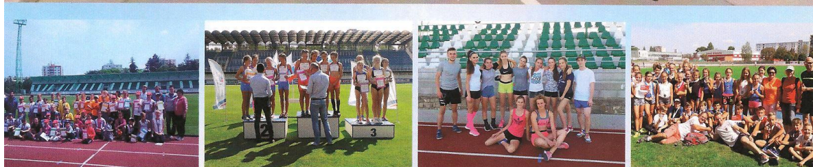
DETSKÁ ATLETIKA V SKALICI